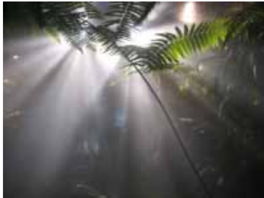
Boomvaren: Cibotium Barometz