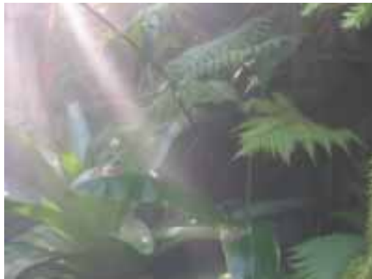
Brochinia - Tapui – Varen