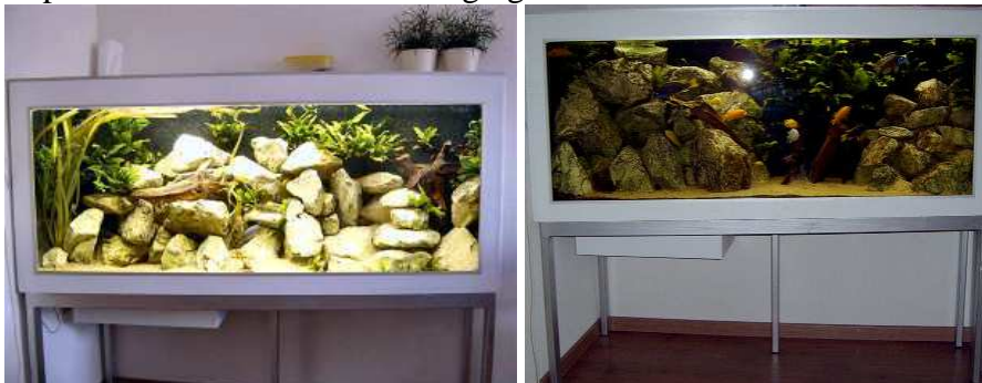
Foto1 zonder flits, foto 2 met flits, foto 2 is de huidige opstelling van de stenen en kienhout.

Bent u serieus geïnteresseerd dan kunt u contact opnemen met Marcel Vermaat (06-17334742). Bij een goed bod kunnen we een afspraak maken voor de bezichtiging.