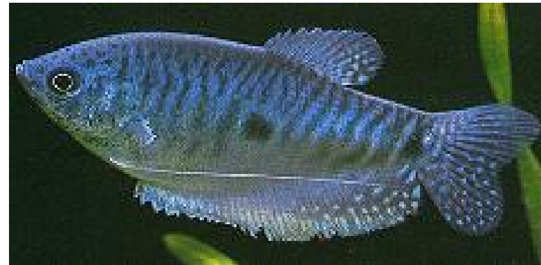
Trichogaster trichopterus -blauwe spat

De blauwe spat is een vis die uitstekend geschikt is voor het gezelschaps-aquarium. Ze kunnen echter ook goed in een Aziatisch biotoop worden ondergebracht, met daarin bijvoorbeeld Indische modderkruipers en kegelvlekbarbelen. Het zijn vreedzame vissen, die zeker op latere leeftijd rustgevend zijn door hun gracieuze manier van zwemmen. Aangezien de vissen zo'n 12 centimeter groot kunnen worden, is een groot aquarium toch wel gewenst. Een aquarium van 80 cm is toch echt het minimum, liever een aquarium beginnend vanaf 100 cm lengte.